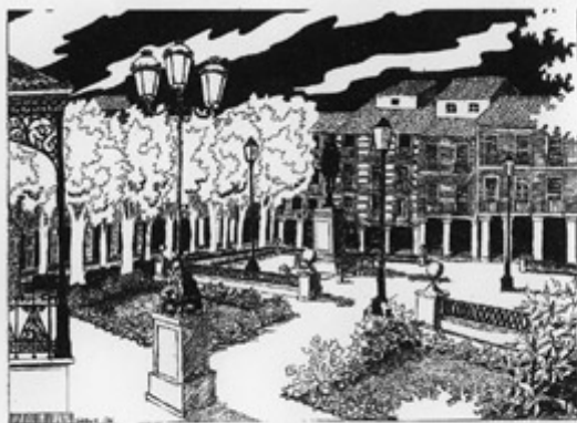
Federico Weber® Plaza de Cervantes

Más libros en la Librería de Javier ---->