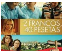
2 francos, 40 pesetas, de Carlos Iglesias