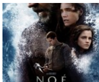
Noé, de Darren Aronofsky