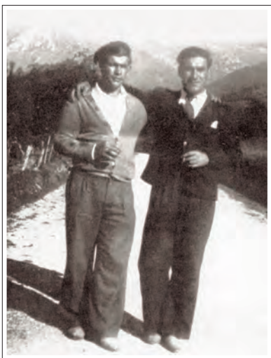
Uztapide eta Basarri, Zaldibian.