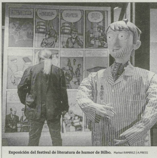
Exposición del festival de literatura de humor de Bilbao.