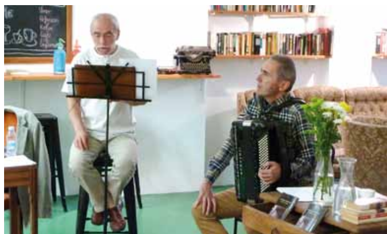
Mugurutzarekin martitzean egin zuen poema musikatu errezitaldia. | EREIN

"Orain urte asko ezagutu genuen elkar. Bi kantu egin ditut haren hitzekin: Heldu artean eta Ezin koplak . Irrikan nago bilduma berria hartzeko, ea hortik ere zerbait ateratzen dudana. Gauza oso sentikorrek eta zuzenak egiten ditu; poesia modernoa da, baina jatorri herrikoiarekin. Metafora asko erabiltzen ditu eta hori oso gustuko dut".