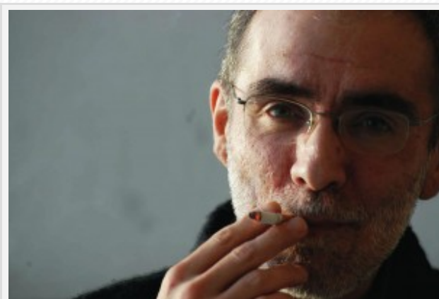
Joseba Olalde argazkilaria zenak zabaldutako leihoa.