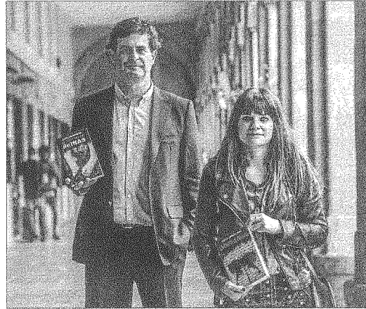
Sagastiberri y Lorenzo, ayer en Donostia.

Lorenzo: «La novela nació de un crimen sin resolver, del dolor de esas familias que ven que no se ha hecho todavía justicia, y cómo los investigadores van dando palos de ciego».