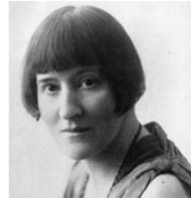
ETHEL LINA WHITE

A pesar de que la trama de esta segunda entrega de la serie es mucho más compleja y está más desarrollada, de momento me quedo con la primera. Quizá la presencia de tantos personajes, tantos sospechosos, tantos elementos, me ha resultado un tanto excesiva. Aún así, considero un verdadero acierto la elección del argumento y que se trate tan abiertamente el tema de los abusos sexuales por parte de un conocido. Por desgracia, la línea que separa el consentimiento del no consentimiento sigue estando muy difusa, y son muchos los que siguen afirmando que si el abuso