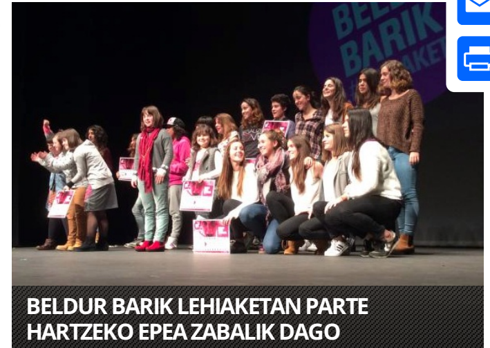
BELDUR BARIK LEHIAKETAN PARTE HARTZEKO EPEA ZABALIK DAGO