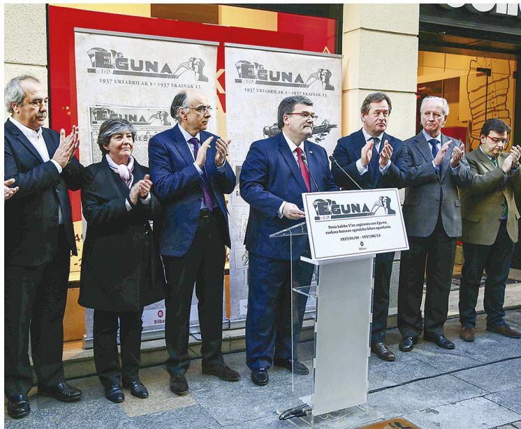
Udalak Posta kalean gogoratu gura izan du euskara hutsean idatzitako lehen egunkaria