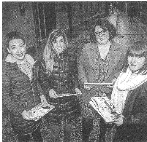
Lau egileak, atzo, Donostian.