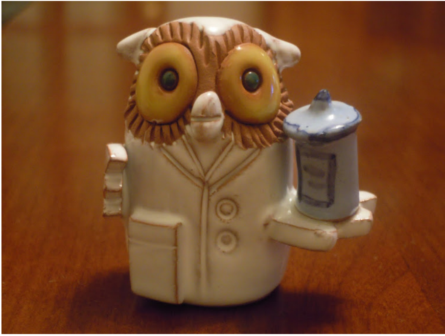
Tema Picture Window. Con la tecnología de Blogger.