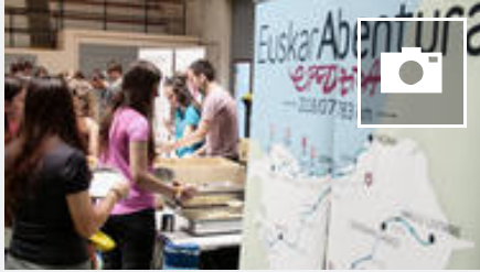
📷 Maule-Lexarretik Getxora