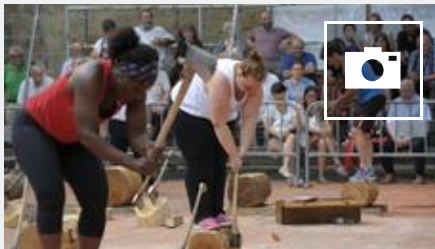
📷 Emakume Aizkolariek txapelketa egin dute Usurbilen