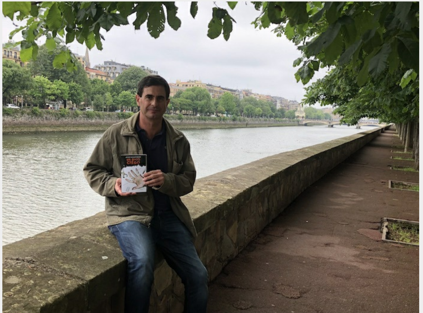
— El escritor vasco Javier Sagastiberri.