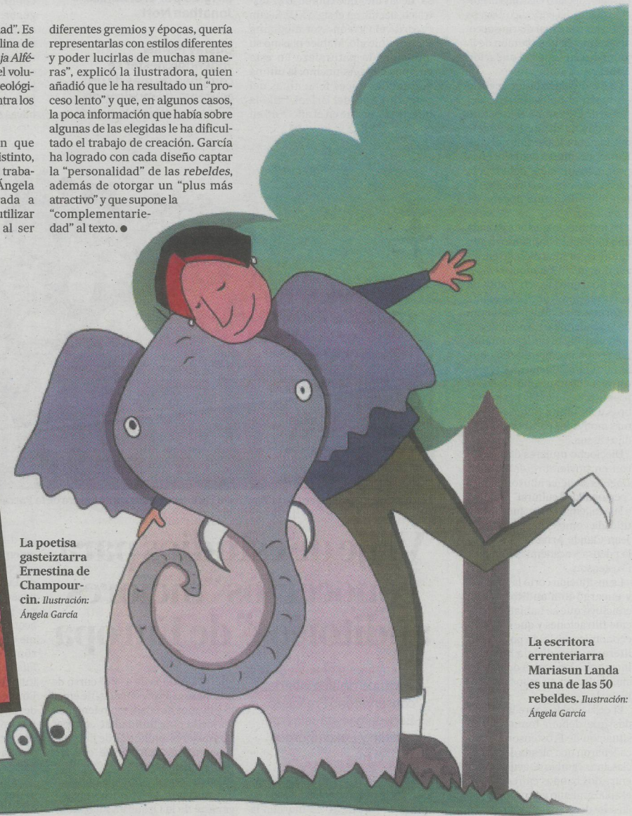
La escritora errenteriarra Mariasun Landa es una de las 50 rebeldes. Ilustración: Ángela García