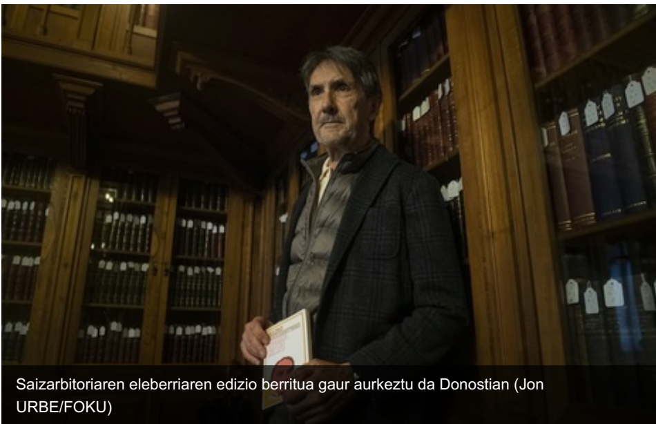
Saizarbitoriaren eleberriaren edizio berritua gaur aurkeztu da Donostian