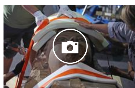
Tutankamón viaja a Londres