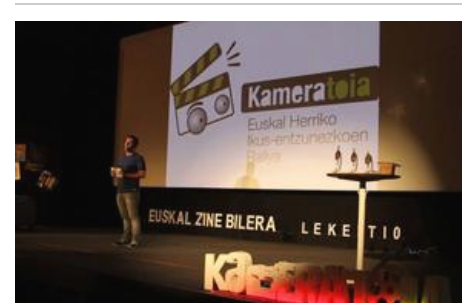
Kameratoian izena emateko epea ireki dute