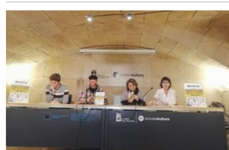
Donostiako toki ezagunen historia ez hain ezaguna