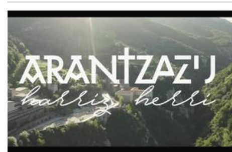
'Arantzazu, harriz herri' Donostian ikusgai izango da