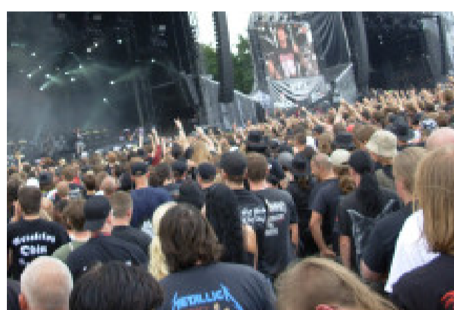
Chispazos de una melómana. © 4 mayo, 2017