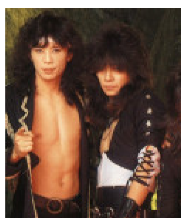
ANTHEM © 30 marzo, 2016