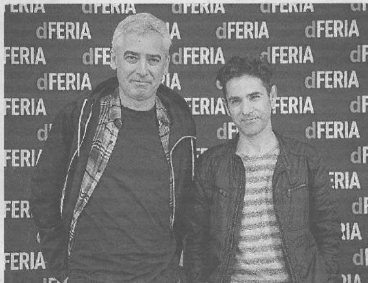
Marie de Jongh konpainiako kideak.