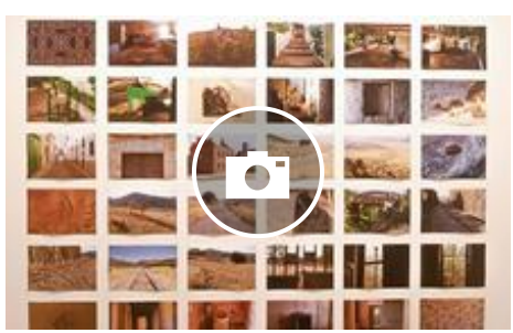
'Sastraka / Maleza', el proyecto compartido de cuatro creadores