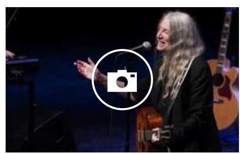
El concierto de Patti Smith en el Kursaal, en imágenes