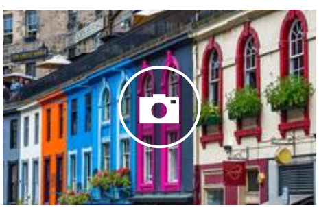
Destinos para una escapada de última hora