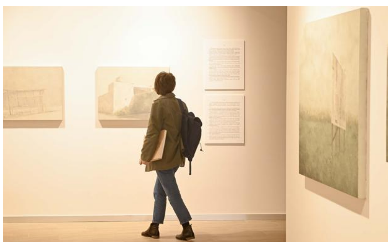
Una imagen de la exposición.

Lo que más han apreciado los participantes de este viaje compartido «es el trabajo de cuatro amigos, juntos y por separado». Porque hay muchas cosas que han hecho y disfrutado juntos, pero cada uno ha recogido el guante a su modo, asomándose incluso a zonas no demasiado frecuentadas con anterioridad. De hecho, Agorreta, Ubeda y Rayo se sumaron al proceso puesto en marcha por Lizarralde con muchas dudas acerca del modo en que podrían llevar a su terreno los textos del escritor guipuzcoano.