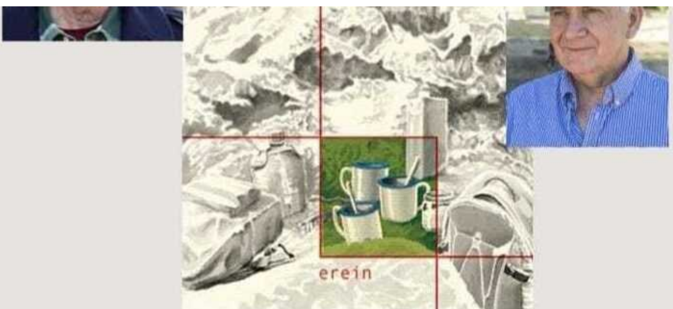
'Arroilaren negarra'ren Gasteizko aurkezpenaren kartela. (NAIZ)

Joan den igandean bete ziren 33 urte «Irunberriko gertakarietatik». Astelehenean, Torturaren Aurkako Nazioarteko Eguna izan zen. Lakuako Gobernuak bertan behera utzi zuen ekitaldi ofiziala , «alderdiek erabil ez zezaten», eta Egiari Zor fundazioak egun hori zela-eta egin zuen ekitaldian Estatu krimenen egia osoa jakin beharra aldarrikatu zuen.