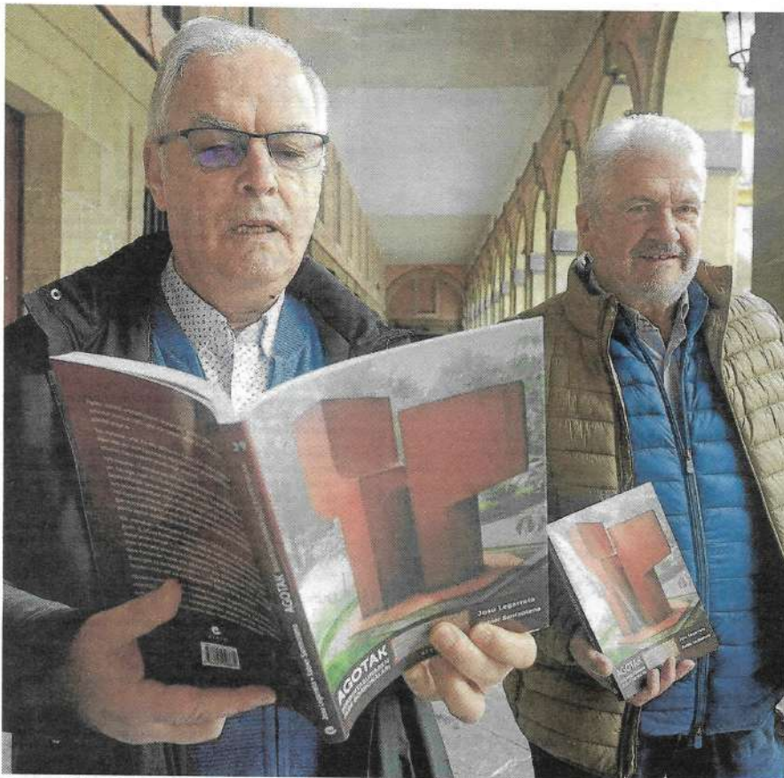
Legarretak eta Santxotena agotei buruzko liburu berria aurkeztu zuten atzo, Donostian.