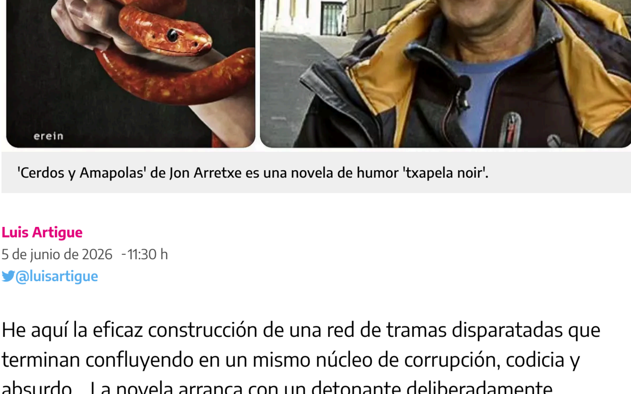
'Cerdos y Amapolas' de Jon Arretxe es una novela de humor 'txapela noir'.

Luis Artigue 5 de junio de 2026 - 11:30 h @luisartigue