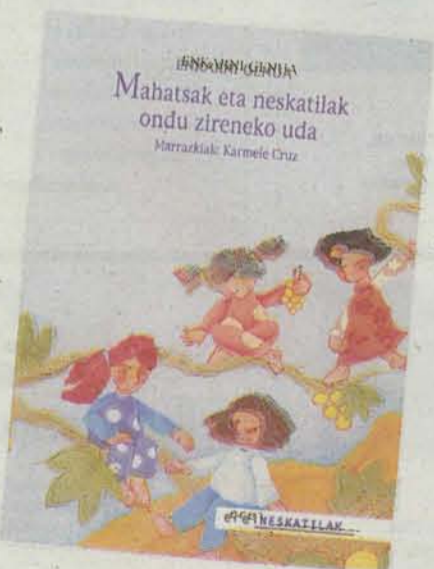
Mahatsak eta neskatilak ondu zireneko uda.

Emakumezko hainbeste ilustratzaile bildu izana arrakastatzaile jo du argitaletxeak. Oraingoz zortzi liburu kaleratu dituzte, baina saila irekita gertatzen da.