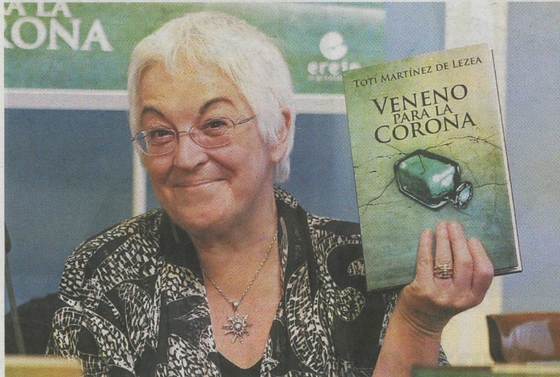
Envenenado. La escritora combina intrigas, venganzas y ambiciones en su nueva novela.

La leyenda apócrifa en torno a si Carlos fue envenenado por su madrastra, Juana Enriquez para que su hijo Fernando tuviera despejada su aspiración al trono, le da pie a Mar-