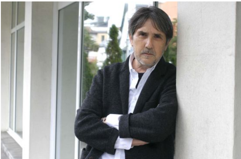
El escritor Ramón Saizarbitoria ayer en San Sebastián.