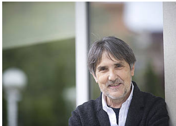
Ramon Saizarbitoria, atzo Donostian, Martutene nobela berriaren aurkezpena egin aurretik.