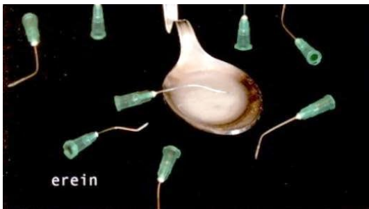
En la mala orilla del río

montones de "aventuras adolescentes" (de Superman a En busca del arca perdida ). Pero en España nos encontramos con el cine de Eloy de la Iglesia y José Antonio de la Loma , para muchos "el verdadero cine de aventuras", con películas como Perros callejeros (1977), Navajeros (1980) o El pico (1983), que transcurrían en nuestros suburbios y, desde una postura "erótico-izquierdista", ensalzaban al joven rebelde.