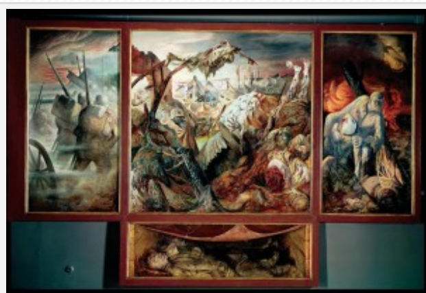
Otto Dix margolariaren Gerra koadroak biztuarazi zion eleberrigileari Zangoztraba idazteko sugarra.